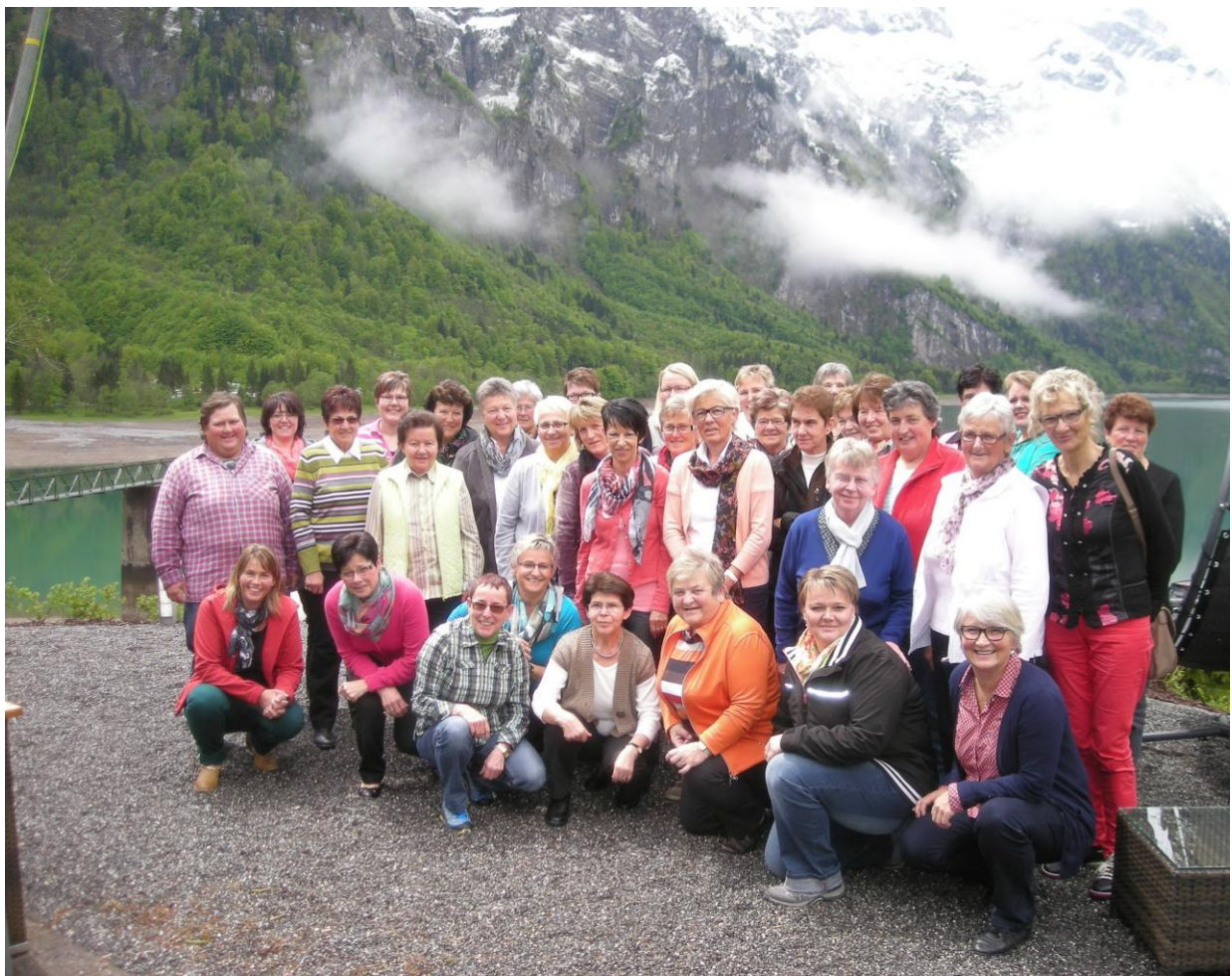
Ausflug 2014 an den Klöntalersee, Glarnerland